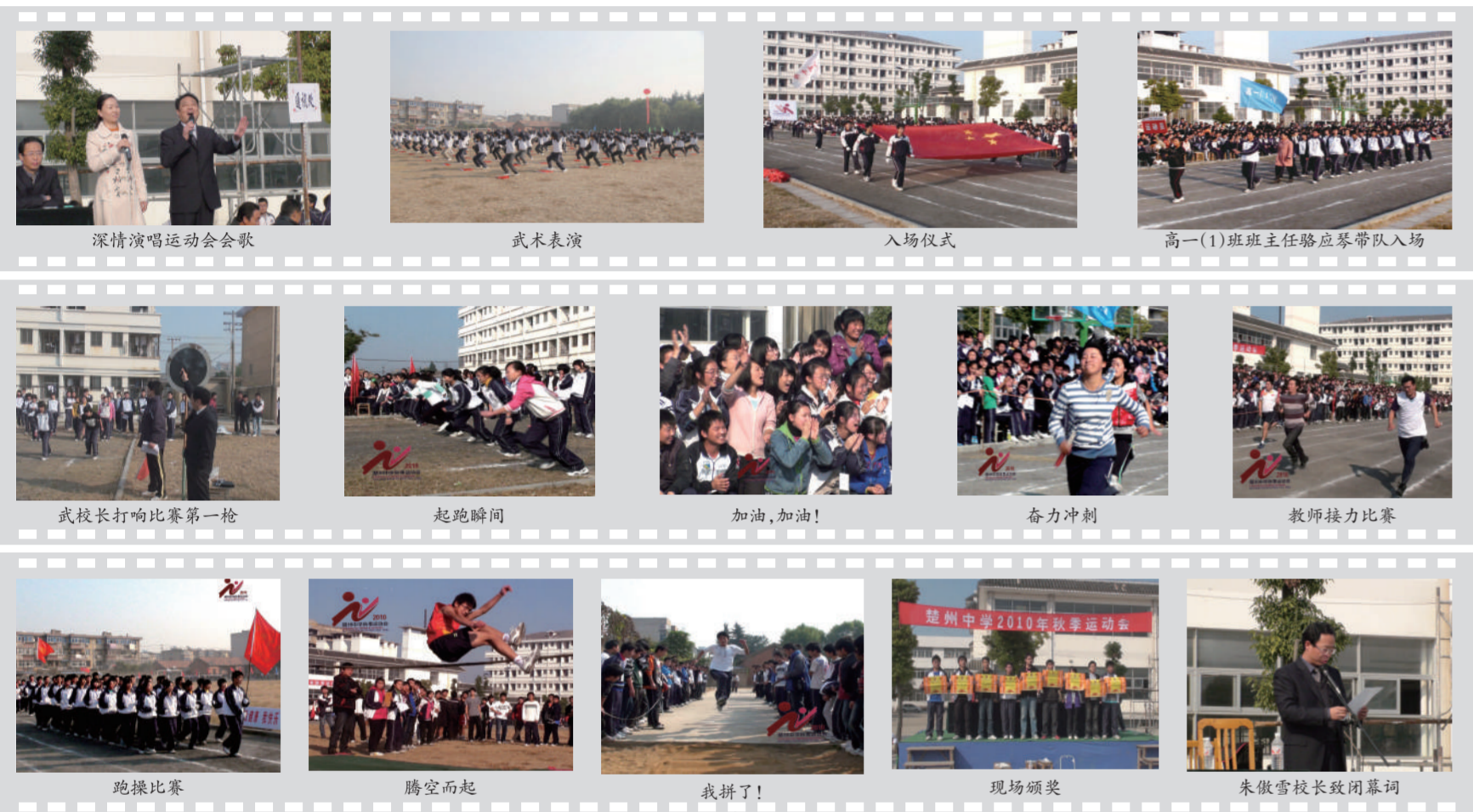
深情演唱运动会会歌